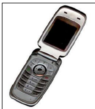
Figura 2 - Ejemplo de una figura con buena resolución.

Análogamente, la Figura 2, nos muestra el ejemplo de una figura con buena resolución.